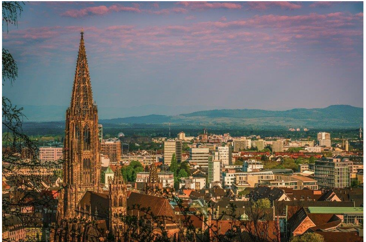
Vue panoramique de Fribourg-en-Brisgau avec la cathédrale Muenster au premier plan et les collines. (Pixabay)