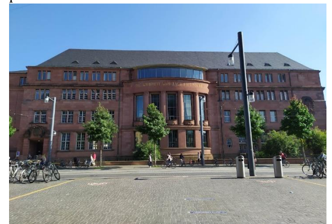
Université du centre-ville en face de la bibliothèque universitaire.

Les logements étudiants (Studentenwohnheime) à Freiburg sont répartis sur plusieurs coins de la ville. La Stusie avec des colocations à 4, à 8, à 10, mais aussi des logements seuls. Seul impératif s'y prendre bien à l'avance pour réserver une chambre. Et bon à savoir pour ceux qui ne souhaitent pas rester un an complet, il est possible de partir plus tôt en payant une petite somme qui permet de clore le contrat annuel à l'avance. A Vauban, vous trouverez un style de vie éco-responsable dans un quartier historique en coloc. D'autres offres de logement se trouvent à Stühlinger et Händel. Pour les personnes voulant s'engager dans une communauté pleine de vie, Sankt Alban vers l'université de la PH à Littenweiler vous ravira avec les colocations à plus de 15 personnes.