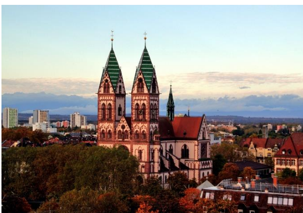
Le double clocher de la Herz-Jesu Kirche dans le quartier de Stühlinger.

Tout d'abord, c'est une chance de vivre dans une ville étudiante multiculturelle, sportive, nature et pleine de surprises. La moyenne d'âge des habitants de Freiburg est de 39,8 ans et fait de cette ville, la plus jeune ville du Land Baden-Württemberg ! Vivante, elle propose un panel de sorties incroyables en toutes saisons.