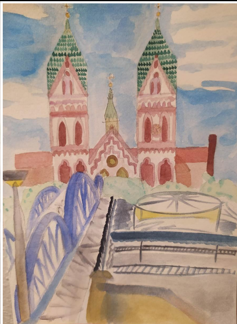
Dessins à la main avec vue

du lac du Seepark et vue du « blaue Brücke », le pont bleu devant la Herz-Jesu-Kirche.